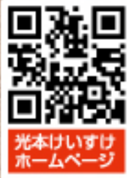
光本けいすけホームページ

今後の行事予定 7月に市内3ヶ所で市政報告会を開催予定! 9月に秋の日帰り旅行を開催予定!