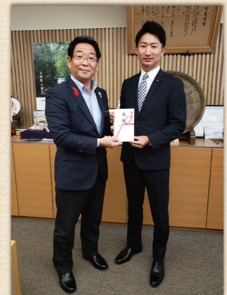
西日本豪雨の被災地支援のため 210万円を兵庫県に寄附 10月30日 兵庫県役所にて福元兵庫県長と。

平成30年4月1日より、さらに「身を切る改革」のやり方を進化させ、 議員報酬の手取り額の2割(10万円)を毎月削減し、被災地や子ども達の未来を救う取組みに寄附しています! 今回は、大阪府と兵庫県に会派として 4月~10月分の総額420万円を寄附しました!