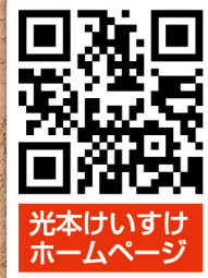
光本けいすけ ホームページ