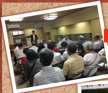
2018年7月に近松記念館で開催した写真です。 尼崎の未来について市政報告会を開催しました。