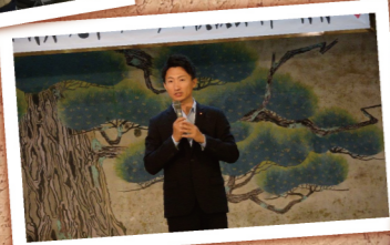
2018年9月9日 秋の旅行での写真です。 湯村温泉で95名の方がご参加くださいました。